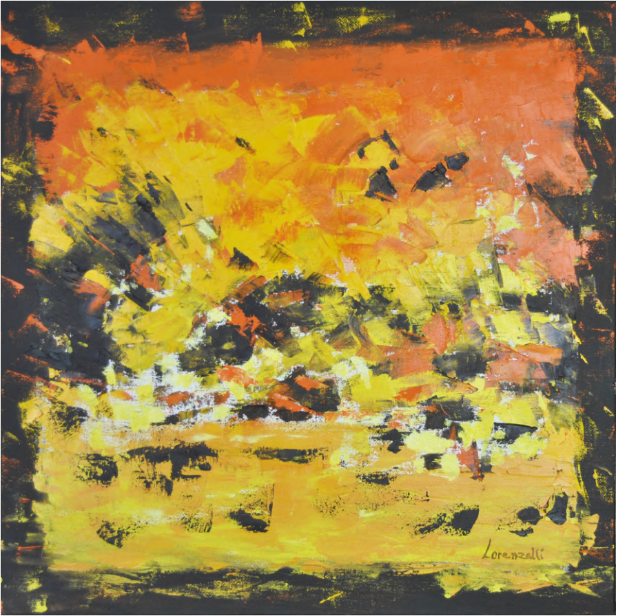
" Cape Town sunset"